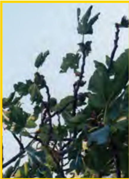
Ficus carica - Feigenbaum