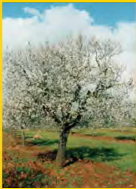
Prunus dulcis - Mandelbaum