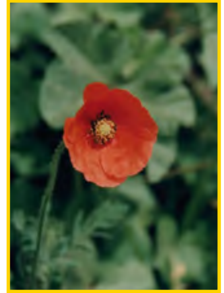
Papaver rhoeas - Mohn