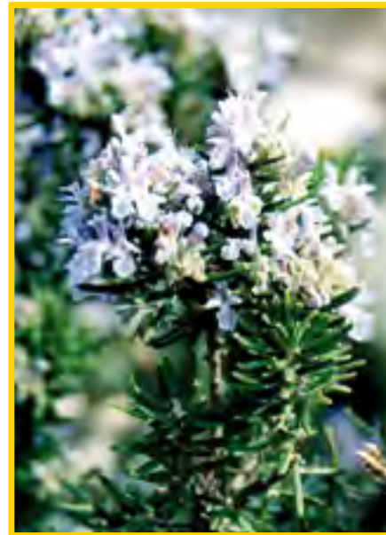
Rosmarinus officinalis - Rosmarin