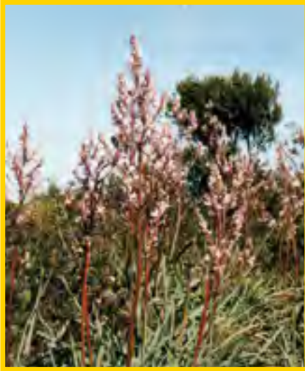
Asphodelus aestivus - Kleinfrüchtiger Affodill