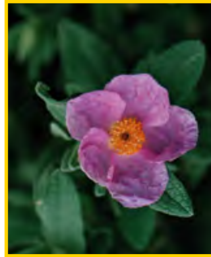
Cistus albidus - Weissliche Zistrose