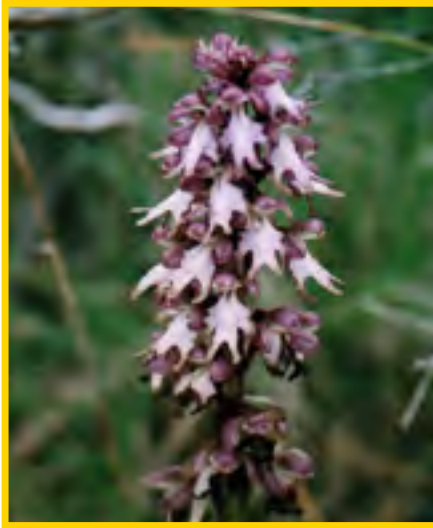
Barlia robertiana - Riesenknabenkraut, Mastorchis