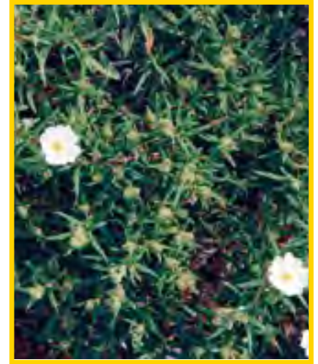
Cistus monspeliensis - Monpellier Zistrose