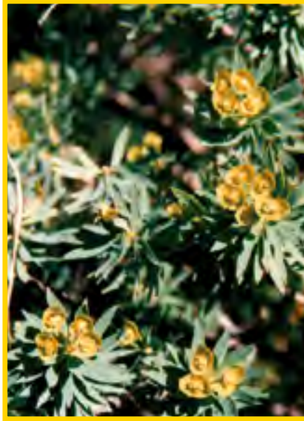
Euphorbia - Wolfsmilch