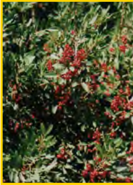
Pistacia lentiscus - Mastixstrauch