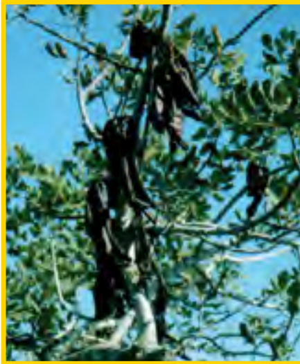
Ceratonia siliqua - Johannisbrotbaum