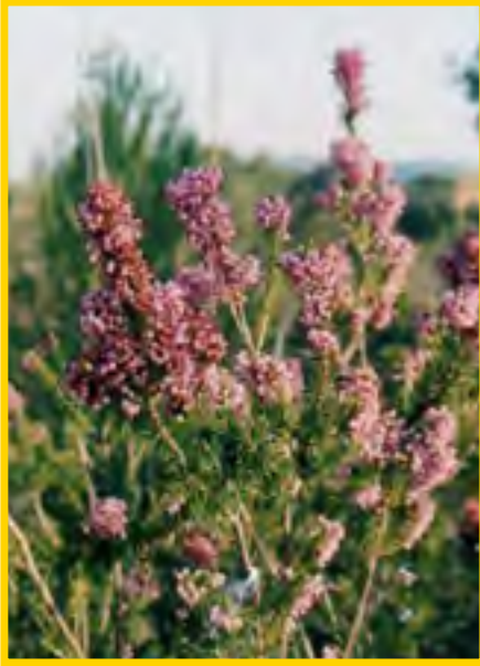
Erica multiflora - Vielblütige Heide