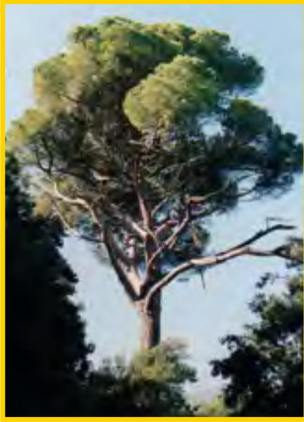
Pinus pinea - Schirmpinie