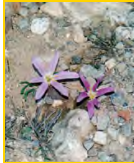
Merendera filifolia - Schmalblättrige Merendera