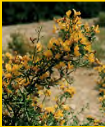
Calicotome espinosa - Dornginster